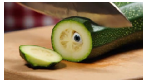
Ratatouille, 2026 Fausse publicité 32 sec

Série de portraits en collage animés autour de personnages dont la passion est le shopping.