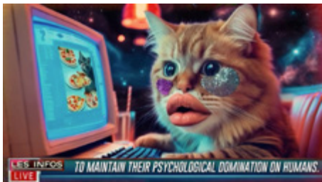
Fake Nious, 2025 Court-métrage expérimental 2 min 25

Fake Nious est un court métrage expérimental utilisant l'intelligence artificielle. Il se déroule comme un déferlement incessant de titres absurdes, de publicités délirantes et de commentaires générés par l'IA. Il s'agit d'une critique sous-jacente de la manipulation de l'information à l'ère des empires numériques, où la notion même de réalité est constamment remise en question.