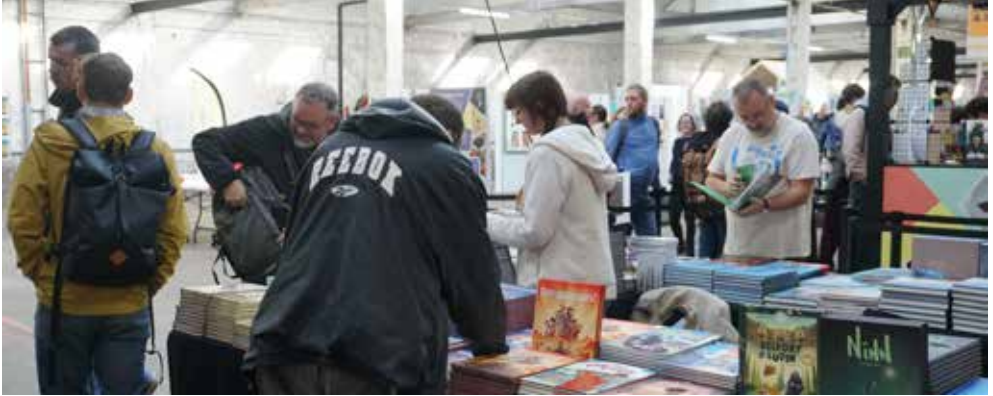
↑ Festival des Livres d'en Haut