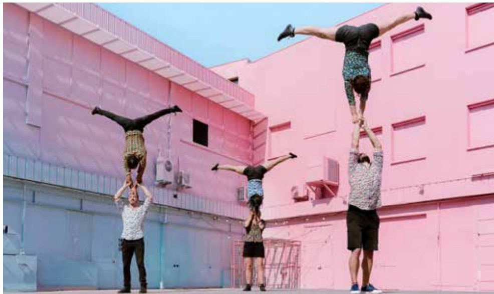
↑ Le Prato à St So, Kontakt