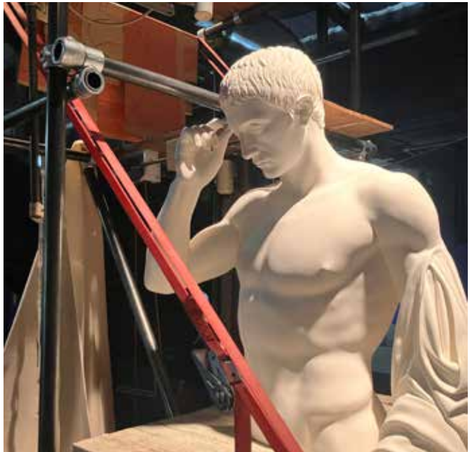
→ Nidhal Chamekh - Lassaad Ben Sghaier, Ode to my Father , 2026